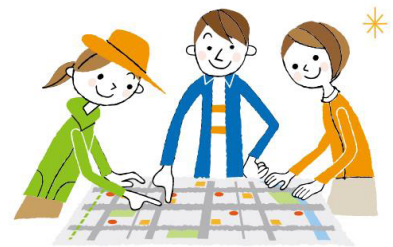
地図をもらって作戦会議