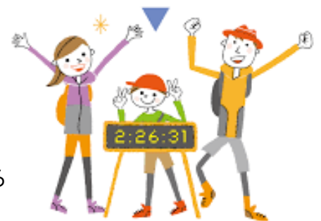
制限時間内にチーム全員でゴール