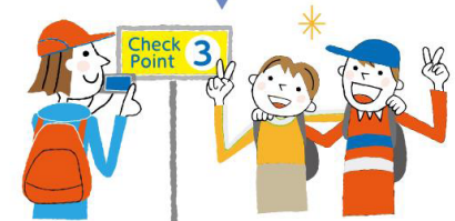
チェックポイントで写真撮影